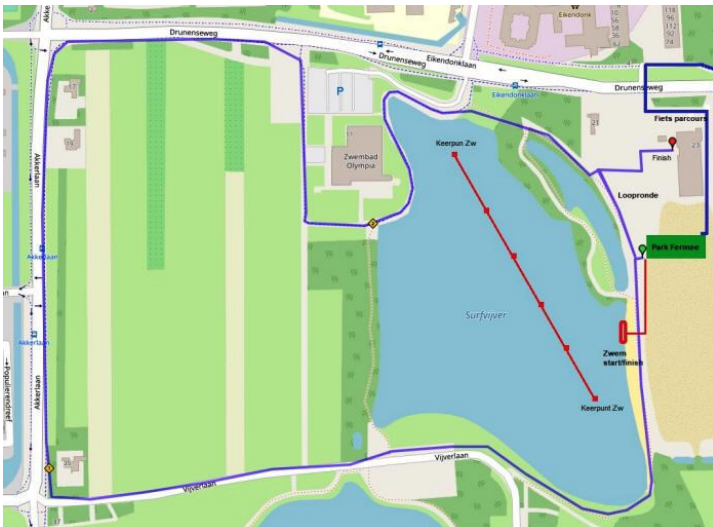
Figuur 1 Loop en zwemparkoers

Bij het lopen is een waterpost bij de doorkomst vlakbij start/ finish. Bij heel warm weer zullen we een tweede waterpost openen op de helft van het loopparcours.