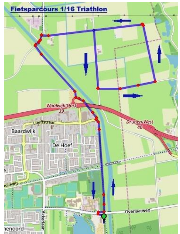
Figuur 1 fietsparcours 1/16e triathlon